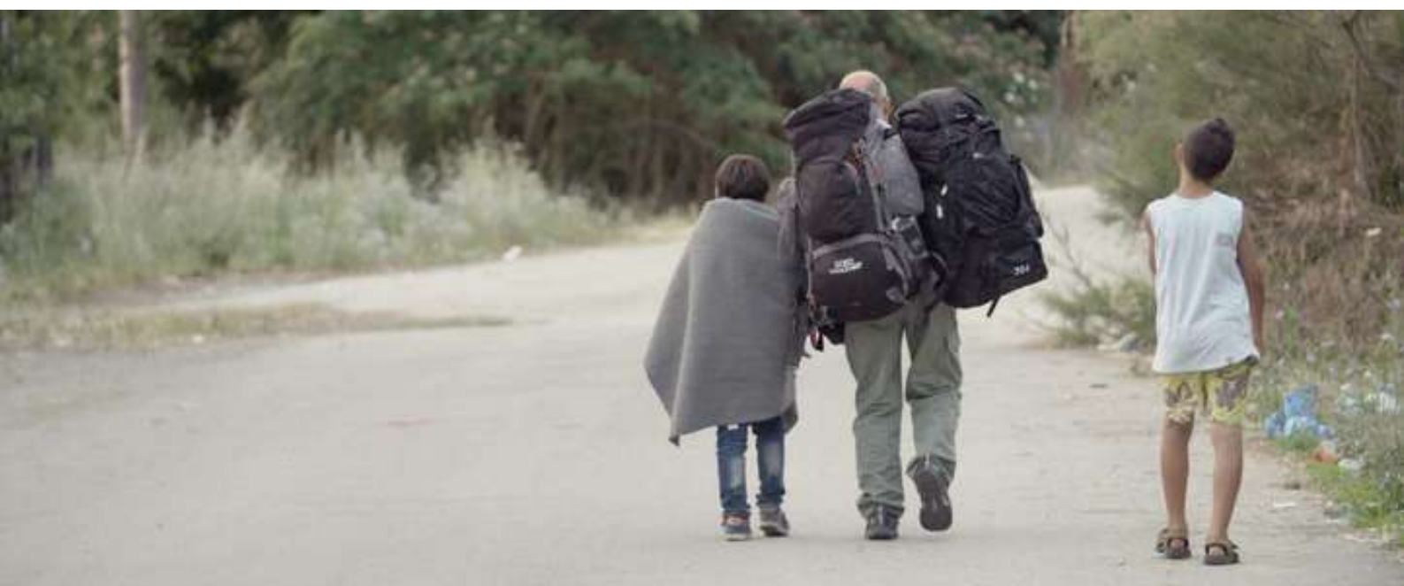
Fotograma de “Nacido en Siria”

Finalmente, la Unión Europea tomó dos medidas para reducir el impacto de esta crisis. La primera, negoció con Turquía para detener el flujo incontrolado de refugiados en el mar Egeo. Dinero a cambio de cerrarles el paso y mantenerlos en campamentos turcos. En segundo lugar, estableció un plan de reubicación de emergencia con el propósito de prestar ayuda a Grecia e Italia, los principales países afectados por la crisis de refugiados. Se trataba de repartirse entre los países europeos 160.000 refugiados. Éste último plan presenta graves deficiencias; señalemos dos: Polonia se ha negado a aceptar la acogida de refugiados y encabeza un grupo de países con la misma posición; otros se comprometen a la acogida pero no la llevan a cabo. Por ejemplo, el Gobierno español se comprometió a acoger a 17.337 personas y en septiembre de 2017 había acogido a 1.980, el 11,4 % de la cuota pactada. Sin comentarios.