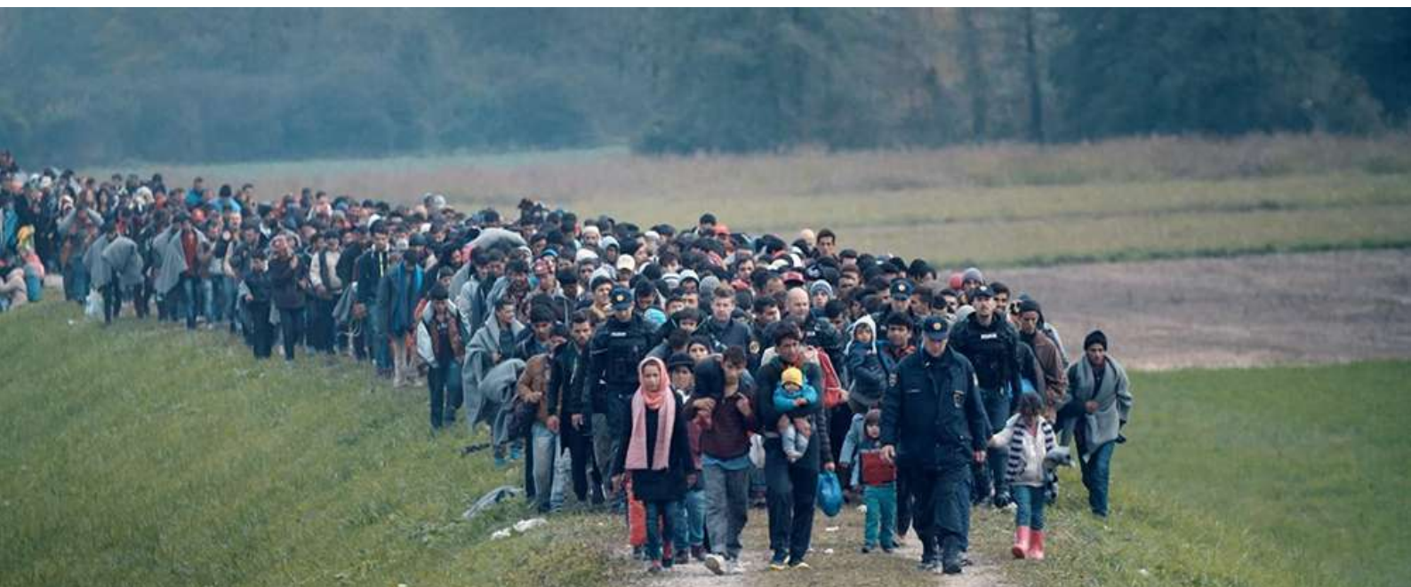
Fotograma de "Nacido en Siria"

El relato nos conduce a través de las etapas de un viaje que concluye para algunos en Alemania o Bélgica, mientras para otros aún continúa la aventura. El asentamiento feliz en Alemania o Bélgica entraña nuevos desafíos. pues junto a los permisos de residencia temporales se afronta el reto de la integración.