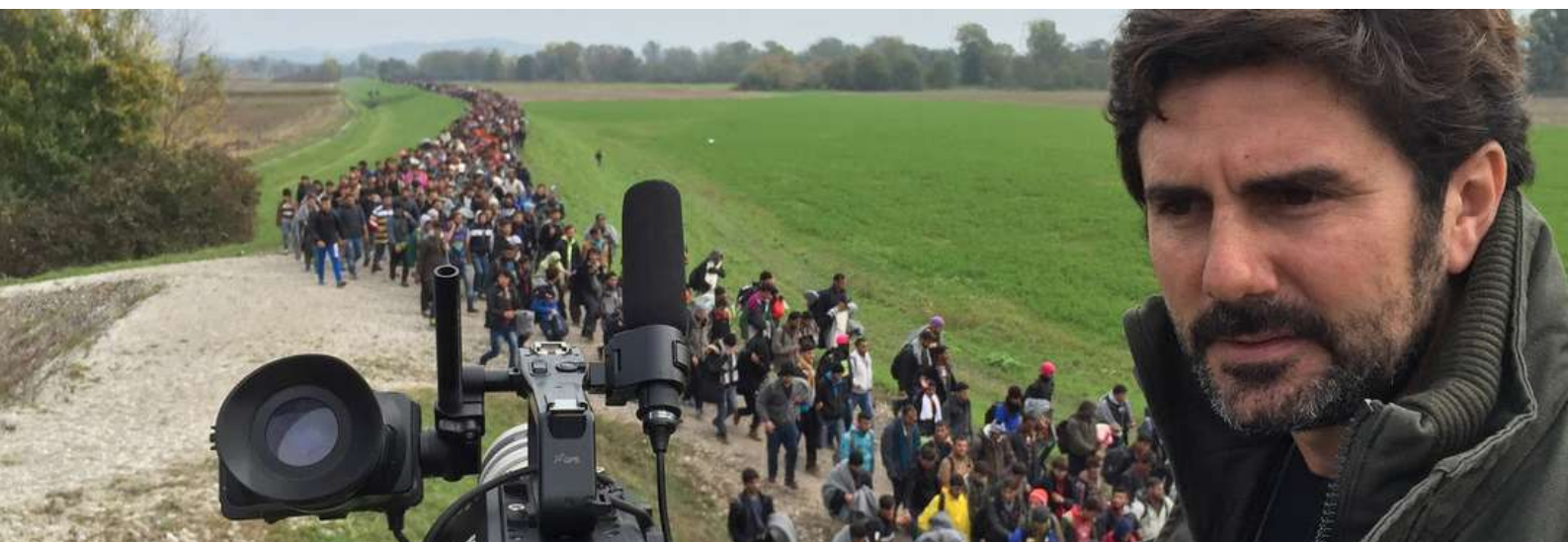
Fotografía de una de las columnas de personas refugiadas grabadas por Hernán Zin