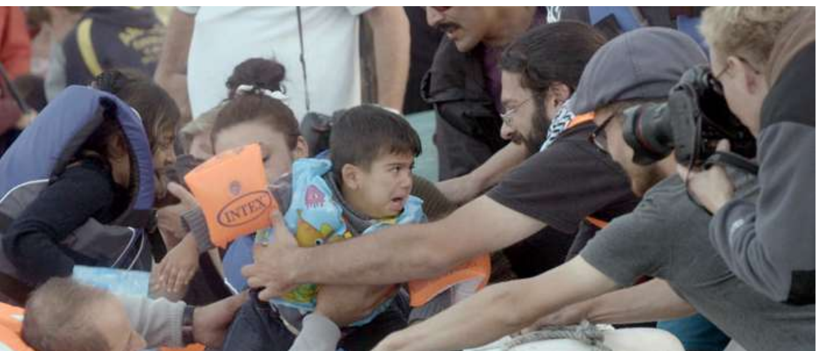
Fotograma de "Nacido en Siria".

Y a lo largo de 2015 buscaron cobijo en Europa. A finales de año se calculaba que habían llegado 850.000. En este mismo periodo habían muerto en el intento más de 3.500. El asunto tiene tal entidad y tales dimensiones que estamos en presencia de la crisis humanitaria más importante a la que ha tenido que hacer frente Europa desde el final de la Segunda Guerra Mundial.